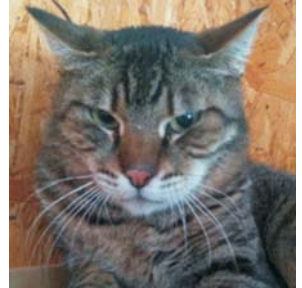
Olympic, 6 Jahre,