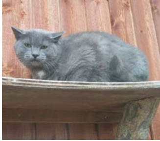
Charles, ca. 3 Jahre dreibeinig

Wir übernahmen in Zusammenarbeit mit dem Deutschen Tierschutzbund 6 Katzen aus dem Partnertierheim in Odessa. Unter sehr schwierigen Bedingungen konnten sie noch rechtzeitig aus dem Tierheim in Odessa in Sicherheit gebracht werden. Vier von sechs Katzen konnten schon ein neues Zuhause finden. Es warten jetzt noch 2 Katzen, nämlich Charles und Olympic, auf ein neues Zuhause.